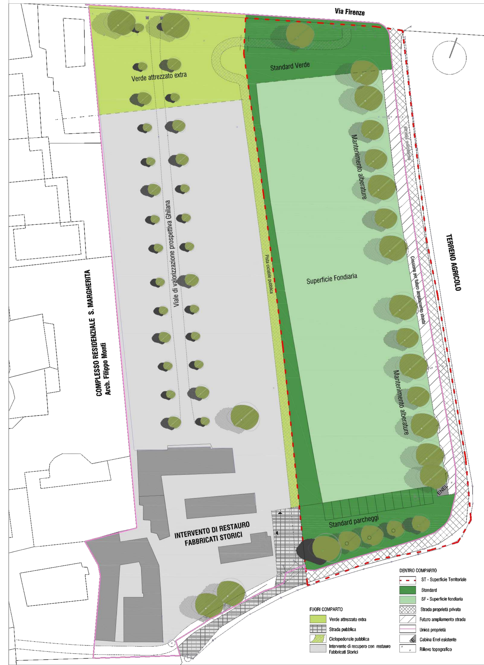
ASSETTO URBANO DI PROGETTO ILLUSTRATO IN SEDE DI PRESENTAZIONE DI PROPOSTA COSTITUENTE MANIFESTAZIONE DI INTERESSE AI SENSI DELL'ART. 4 DELLA L.R. N. 24 DEL 21/12/2017 (SCALA 1:500)